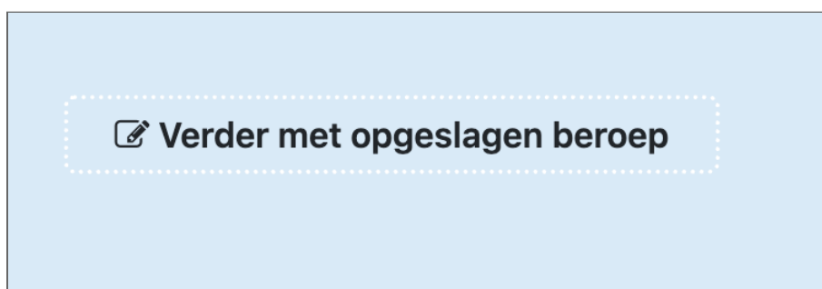
Figuur 5: de focusrand heeft erg weinig contrast