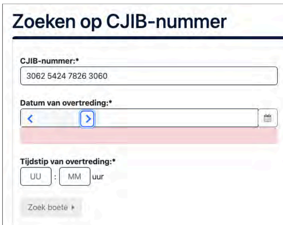
Figuur 3: het kiezen van een datum is erg onduidelijk