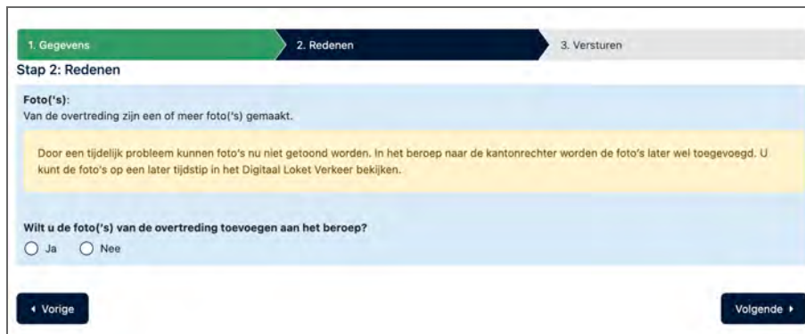
Figuur 1: De tekst van de eerste stap heeft onvoldoende contrast