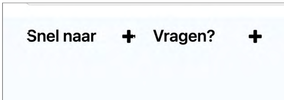
Figuur 6: de focus is nauwelijks zichtbaar vanwege een witte rand op voornamelijk witte ondergrond