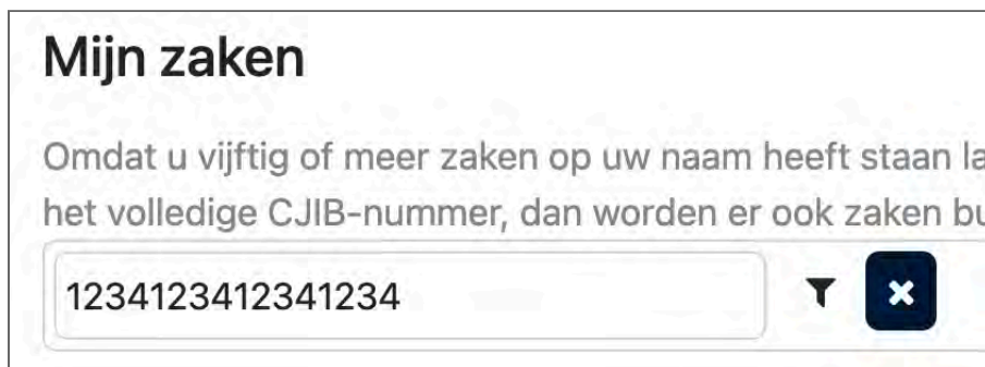
Figuur 4: bij focus is er geen rand te zien, alleen omgekeerde kleuren